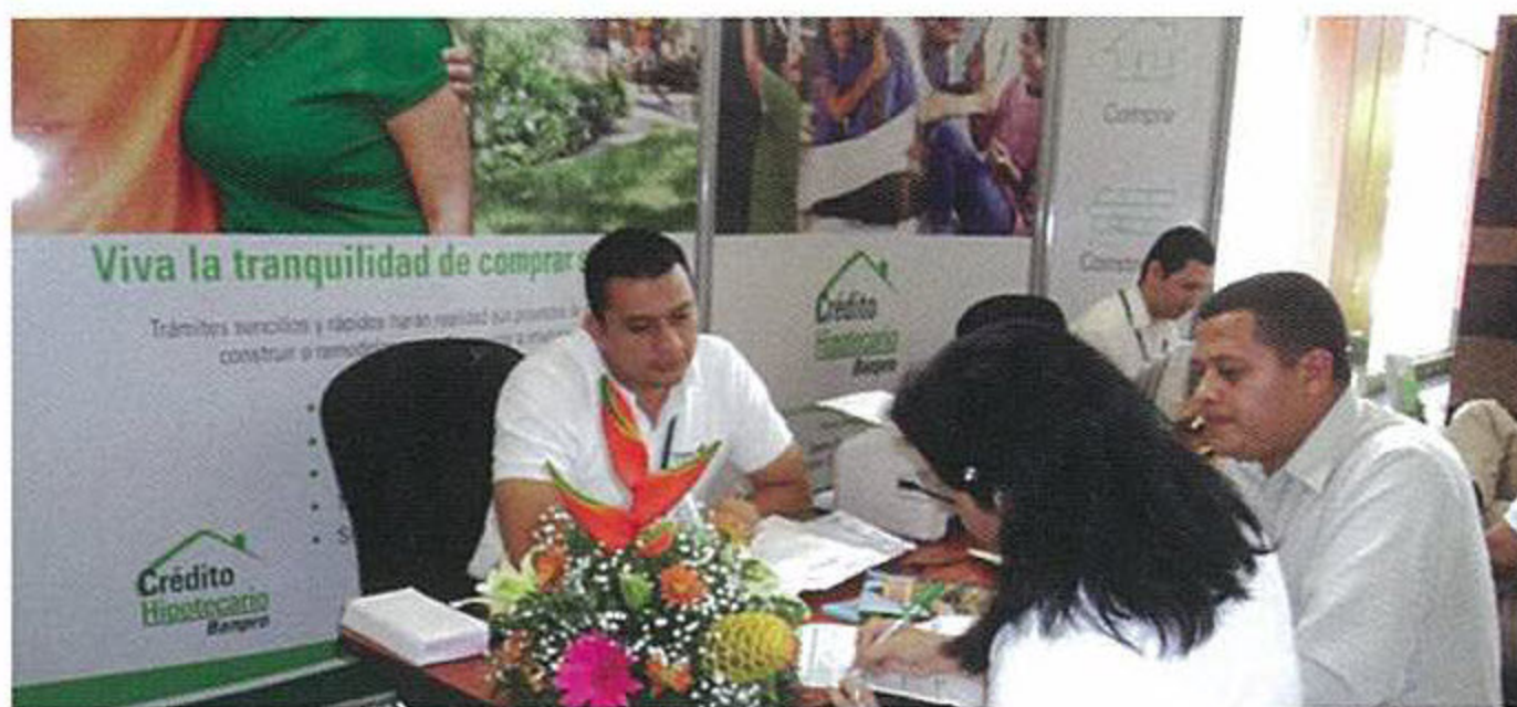
* Aplican Restricciones.

0% gastos de cierre, plazo a 15 años y tasas de interés desde 4.5%*.