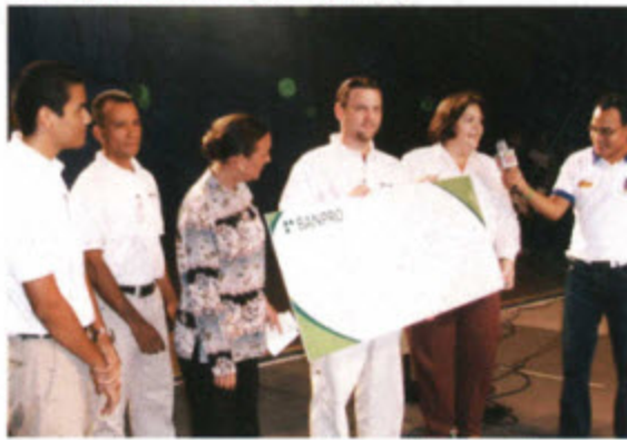
Un grupo de ejecutivos, hicieron entrega de la donación de BANPRO al TELETON 2007.