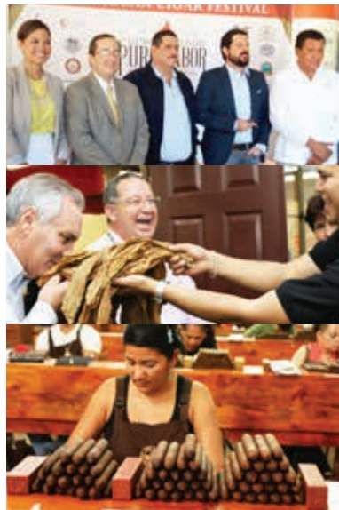
Puro Sabor Nicaragua 2016", realizado en los departamentos de Managua, Chinandega y Estelí, con la participación de más de 200 visitantes de 27 países de diferentes partes del mundo.

Los puros nicaragüenses se consumen en unos 79 países alrededor del mundo, debido a la gran demanda en el mercado internacional, las fábricas nacionales están produciendo y exportando entre 150 y 170 millones de unidades anualmente, para satisfacción de los más exigentes paladares, así lo confirmó el Lic. Juan Ignacio Martínez, presidente de la Cámara Nicaragüense de Tabacaleros, durante la celebración del "V Festival del Tabaco