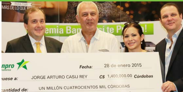
Ganador de Premia si te premia Navidad.