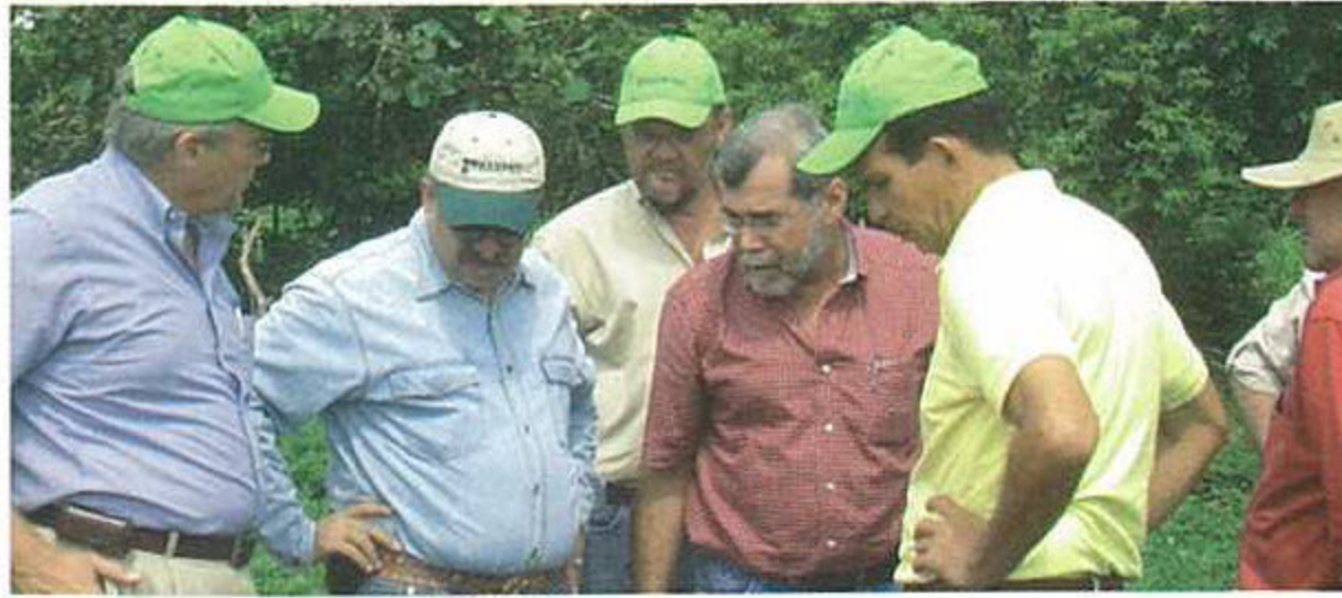
Productores de Occidente, visitados por principales ejecutivos de BANPRO.

Varias razones importantes sobre nuestra relación con los agricultores y productores nacionales: