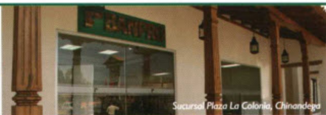
Sucursal Plaza La Colonia, Chinandega