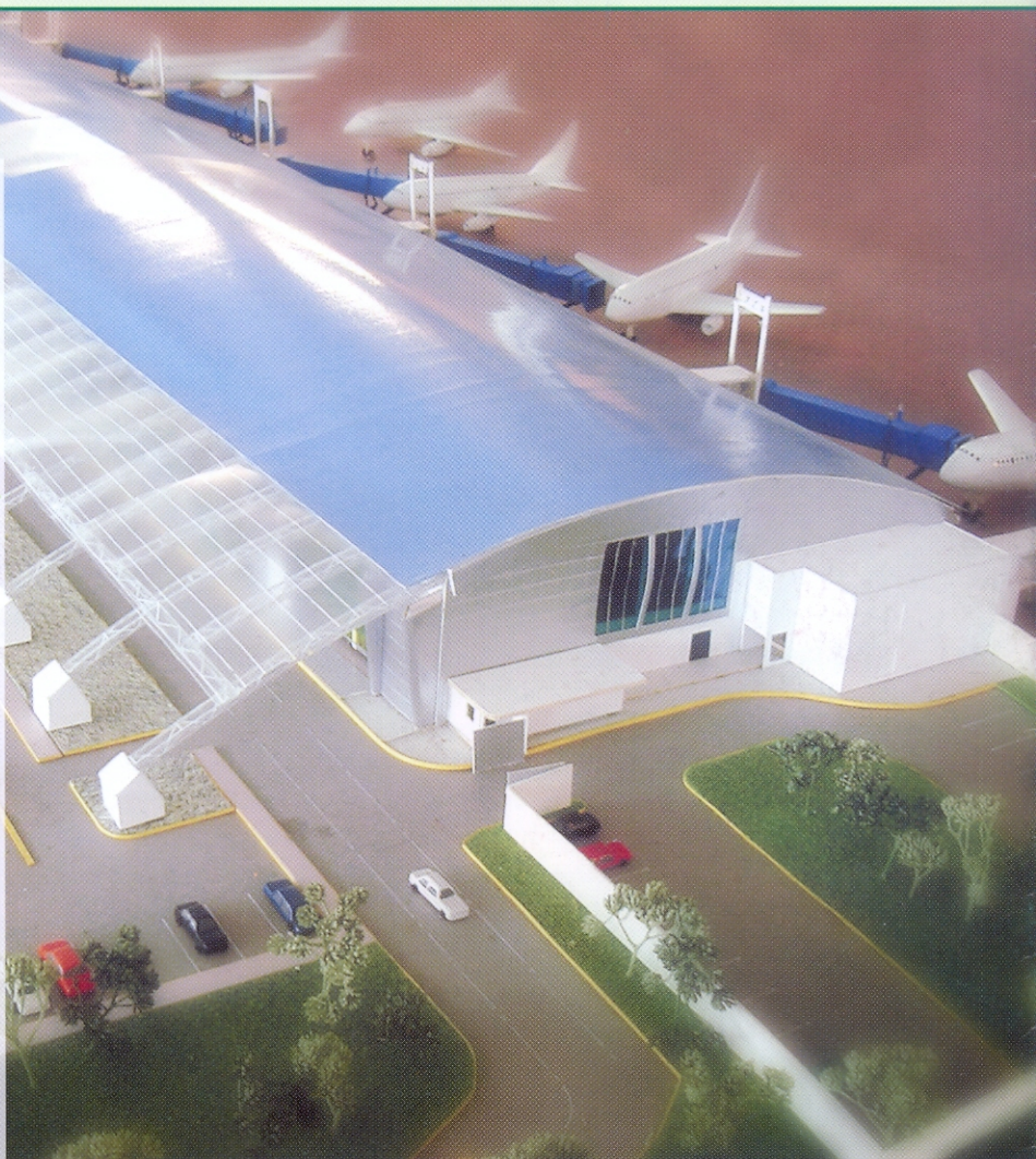
Maqueta Aeropuerto Internacional de Managua.

En la inauguración participaron el Presidente de la República, Ing. Enrique