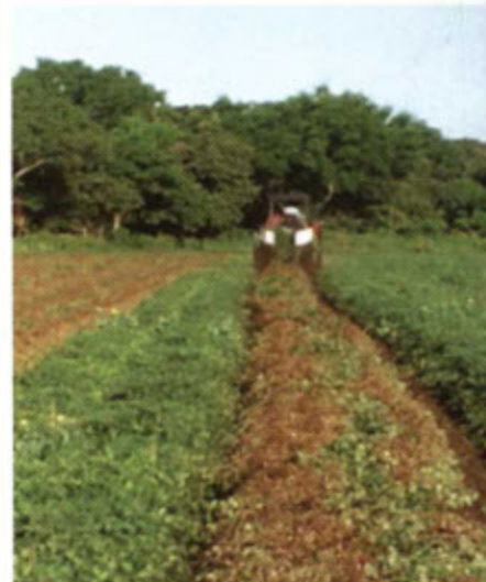
Recolección del Maní.