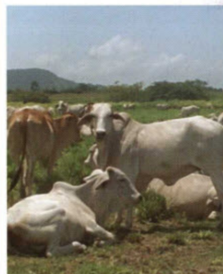
Crianza de ganado.